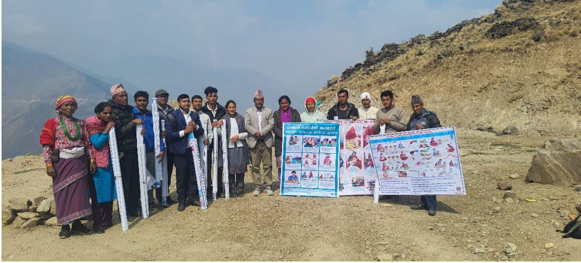
पोषणका फेल्क्स वितरण