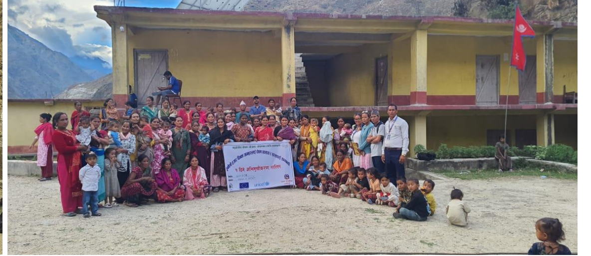
सुनौलो हजार दिनका आमालाई पोषण सम्बन्धि अभिमुखिकरण